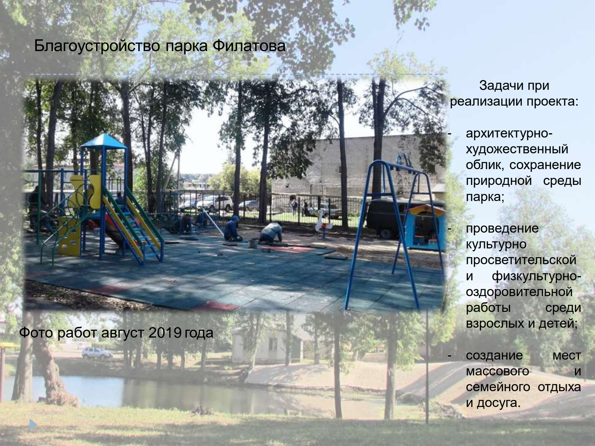
Фото работ август 2019 года