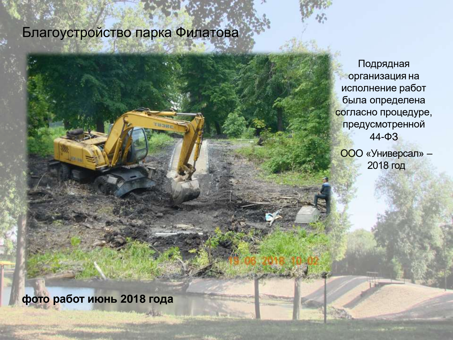
фото работ июнь 2018 года