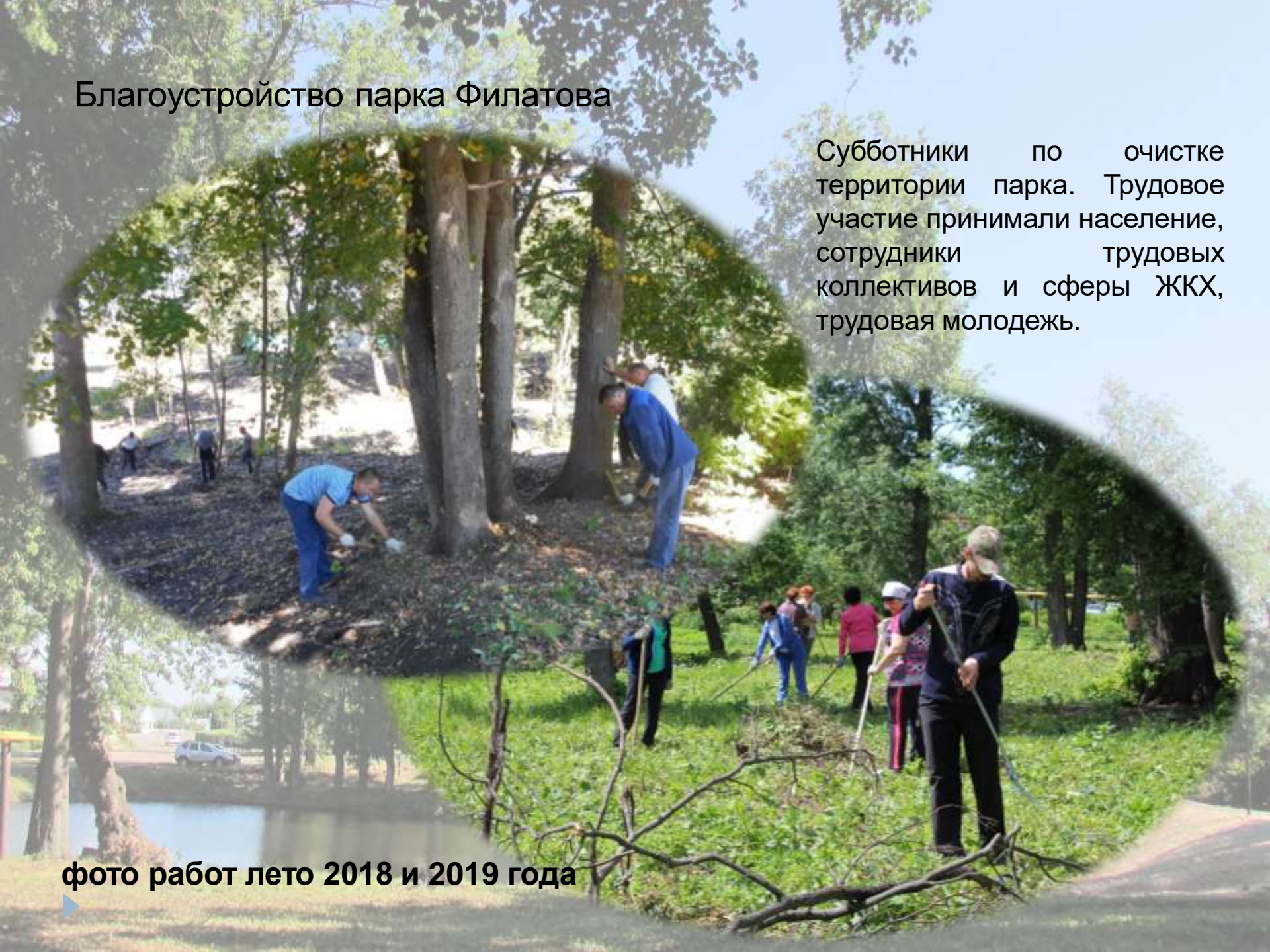
фото работ лето 2018 и 2019 года

Субботники по очистке территории парка. Трудовое участие принимали население, сотрудники трудовых коллективов и сферы ЖКХ, трудовая молодежь.