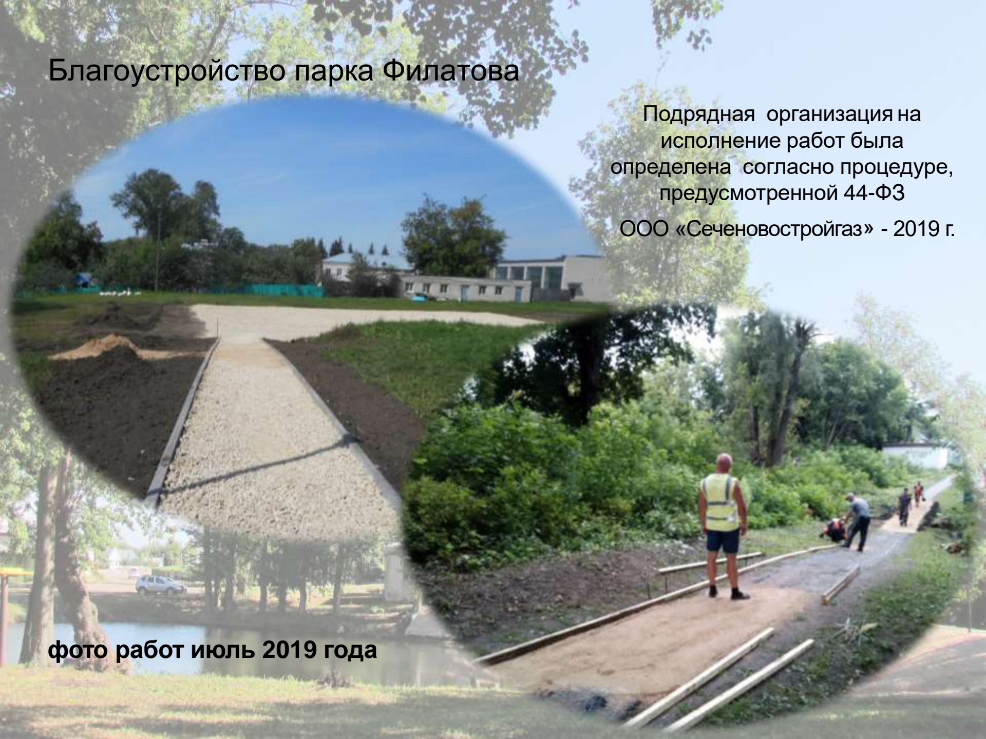
фото работ июль 2019 года