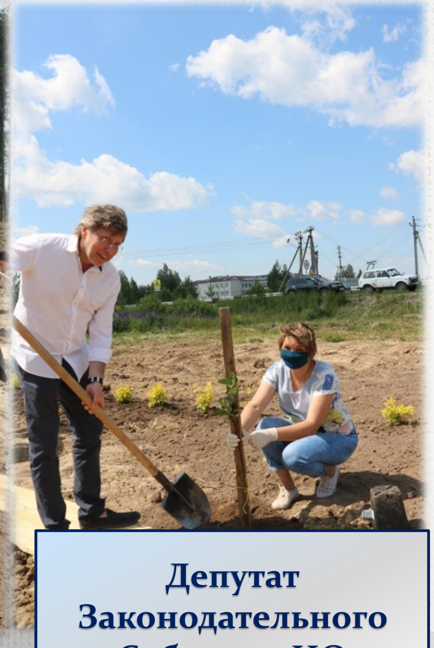
Депутат Законодательного Собрания НО А.В.Вилков