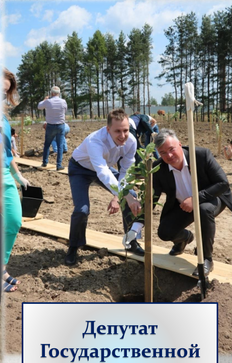
Депутат Государственной Думы РФ А.А.Кавинов