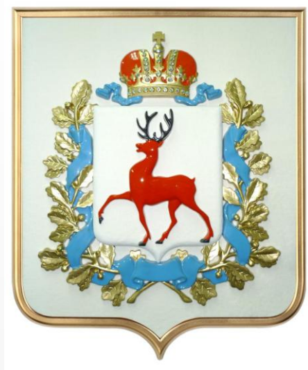
Правительство Нижегородской области