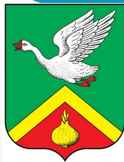
Администрация Ломовского сельсовета Арзамасского муниципального района